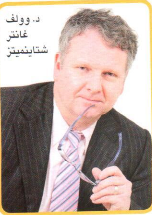
د. وولف غانتر شتاينميتز

هذه العملية ليس تخفيض الوزن! لذا، يجب أن تتمتع بصحة جيدة وباللياقة وألا تعاني من أية التهابات في الجلد.